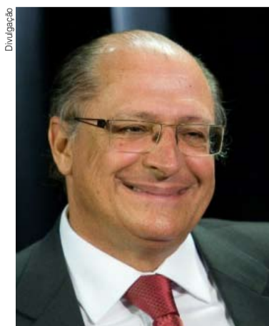
Alckmin: "Não vejo mais necessidade"