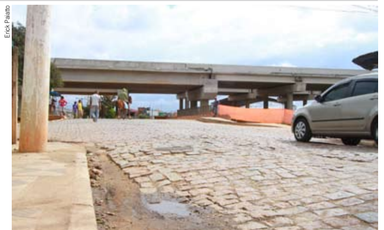
Ruas que ficam no entorno do trecho da construção foram danificadas