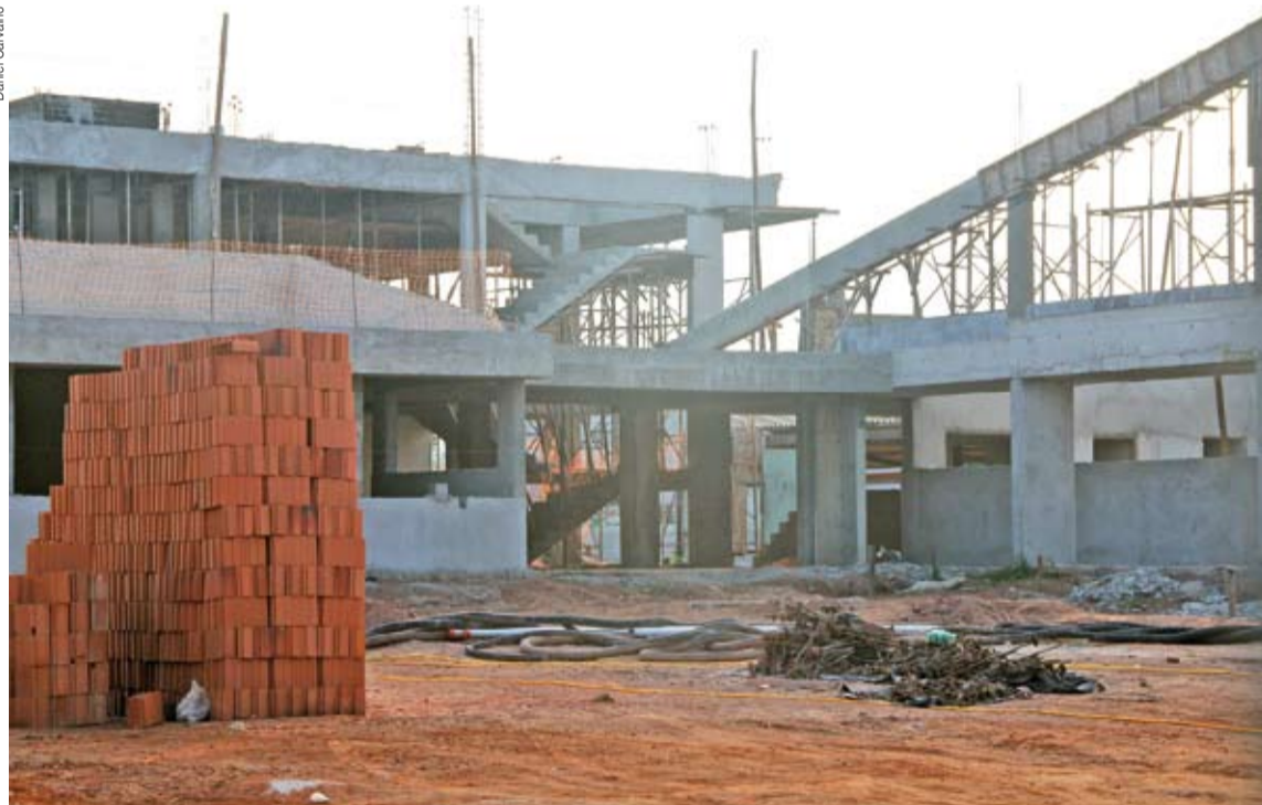
Obras, que deveriam ter sido entregues em janeiro deste ano, foram paralisadas em maio por causa de atrasos

● A Companhia Paulista de Obras e Serviços (CPOS), ligada ao governo do Estado, vai fazer um estudo para avaliar as obras do Fórum de Brás Cubas. A construção do prédio foi paralisada em maio por atrasos. Agora, uma nova construtora terá de ser escolhida, por meio de licitação, para concluir a obra que teve início em 2013 e que tinha a previsão de ser entregue em janeiro deste ano. Cidade, página 6